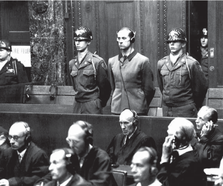
Karl Brandt bei der Urteilsverkündung im Nürnberger Ärzteprozess am 20. August 1947

Eine Kooperation mit der Veranstaltungsreihe zum »Denkmal der Grauen Busse«