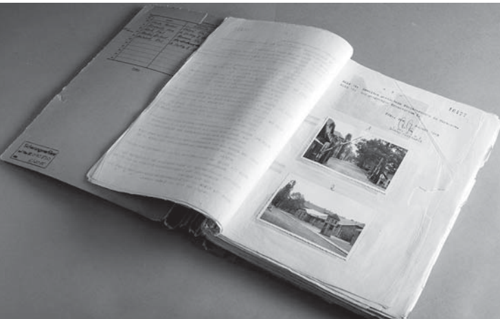
Akten zum ersten Frankfurter Auschwitz-Prozess

Überlebende aus Polen, der Sowjetunion, Israel und Deutschland sagten in diesem Prozess aus. Ihre Stimmen, die Vernehmungen vor Gericht, das Agieren von Richtern, Staatsanwaltschaft, Nebenklagevertretern, Verteidigern und Dolmetschern sind in Aktenform und auf Tonbändern verfügbar. Mit ca. 430 Stunden Tonaufnahmen und den umfangreichen Verfahrensakten der Staatsanwaltschaft in 456 Einzelbänden auf über 50.000 Seiten verfügt das Hessische Hauptstaatsarchiv über einen einzigartigen Fundus an Quellen für die Erforschung des Holocaust, aber auch für den Ablauf im Gerichtssaal. Mehr als 50 Jahre nach dem Prozess sind die Tonbänder und Verfahrensakten längst als Quellen in die historische Forschung eingegangen. Was können wir aus diesem Material lernen? Wie hat es unsere Sicht auf das Geschehen in Auschwitz geformt? Welche Absichten der Prozessbeteiligten lassen sich aus den Quellen ableiten? Welche Fragen muss die Geschichtswissenschaft an das Material stellen? Diese und andere Themen werden auf der Tagung behandelt.