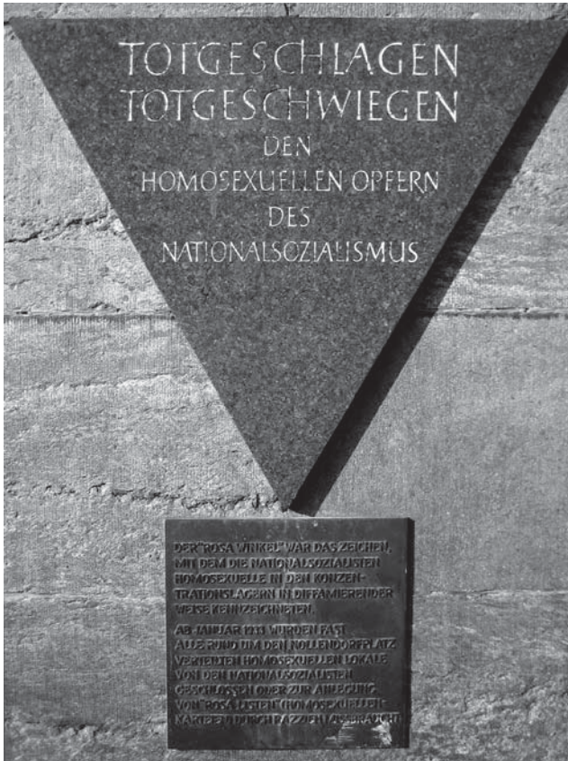
Erinnerung an die Verfolgung Homosexueller zur Zeit des Nationalsozialismus am Nollendorfplatz in Berlin, 2009

Eine Kooperation mit der Katholischen Akademie Rabanus Maurus, Frankfurt am Main