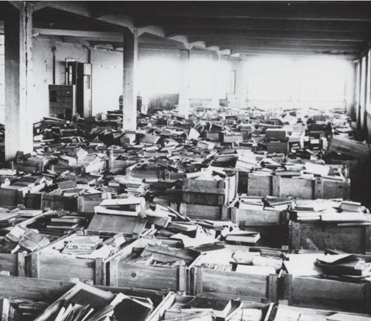
Kisten mit unsortierten Büchern im Offenbach Archival Depot, 1946

Eine Kooperation mit dem Jüdischen Museum Frankfurt