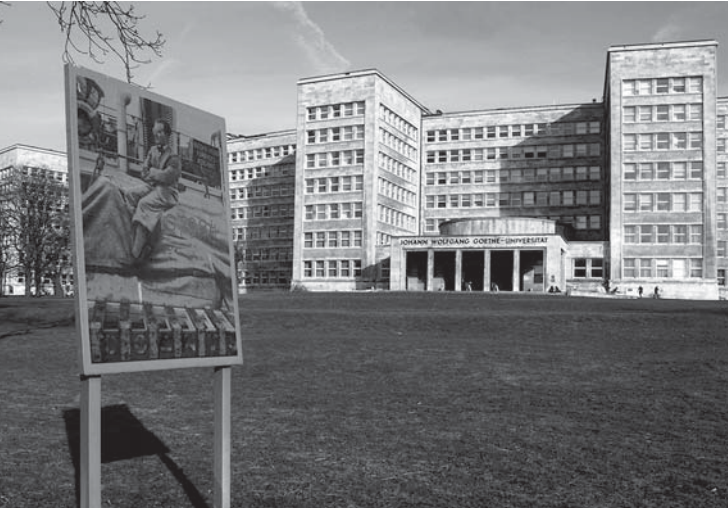
Fototafel von Norbert Wollheim vor dem IG Farben-Haus

Offene Führungen finden am dritten Samstag eines Monats um 15.00 Uhr statt. Treffpunkt ist der Norbert Wollheim Pavillon auf dem Campus Westend der Goethe-Universität. Zugang zum Pavillon über die Fürstenberger Straße und den Fritz-Neumark-Weg. Die nächsten Termine finden Sie unter: www.fritz-bauer-institut.de