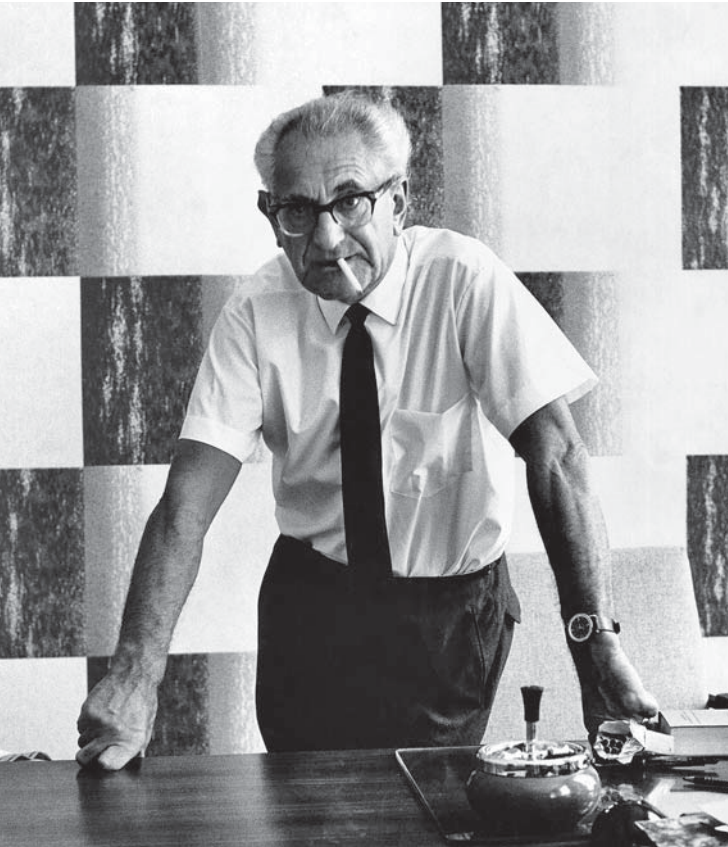
Fritz Bauer in seinem Amtszimmer im Frankfurter Landgericht