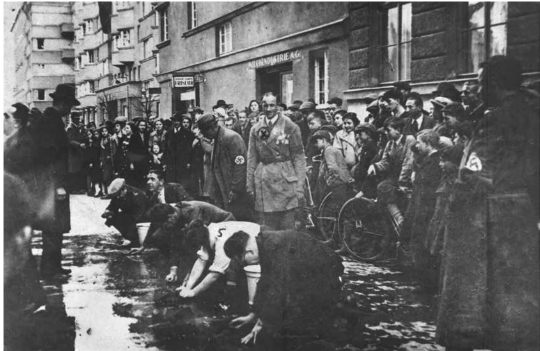
Wien, Stadtteil Erdberg, im März 1938. Jüdische Männer werden zum sogenannten Gehsteigreiben gezwungen.