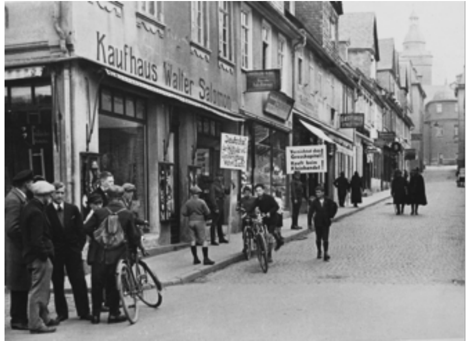
Boycott von Geschäften jüdischer Inhaber am 1. April 1933 in Weilburg/Hessen, fotografiert von Mitgliedern der NSDAP.