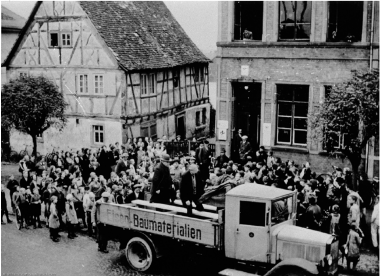
– Die hessische Kleinstadt Langenselbold am 11. November 1938.

– Die dort verhafteten jüdischen Männer wurden zunächst im Rathaus festgehalten. Das Foto zeigt, wie sie den Lastwagen einer Baufirma besteigen, der sie nach Hanau in das Gefängnis im Fronhof brachte. Von dort aus wurden sie mit dem Zug in das Konzentrationslager Buchenwald transportiert.