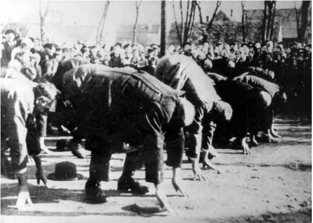
– Jüdische Bürger aus Groß-Gerau/Süd Hessen wurden am 10. November 1938 auf dem Marktplatz vor vielen Zuschauern öffentlich gedemütigt.

– © Sammlung Paul Arnsberg, Jüdisches Museum Frankfurt am Main