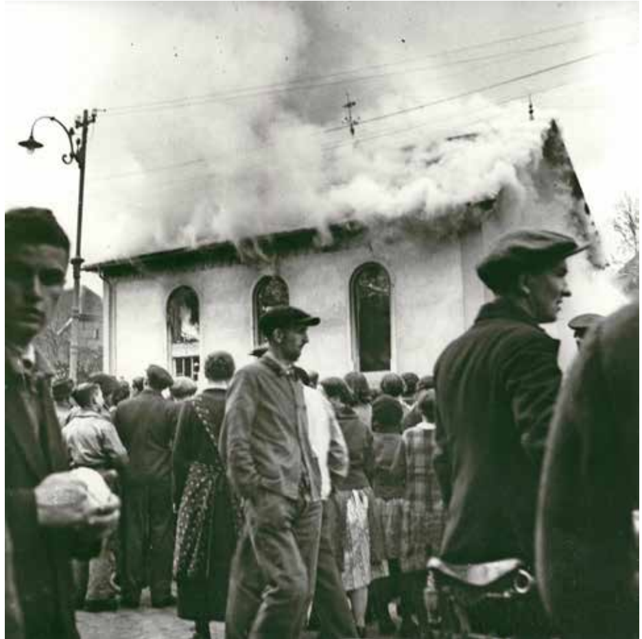
Zuschauer in Ober-Ramstadt im Odenwald am 9. November 1938

Die Synagoge in Ober-Ramstadt im Odenwald wurde am 9. November 1938 zerstört und in Brand gesetzt. Die Bevölkerung schaute zu.