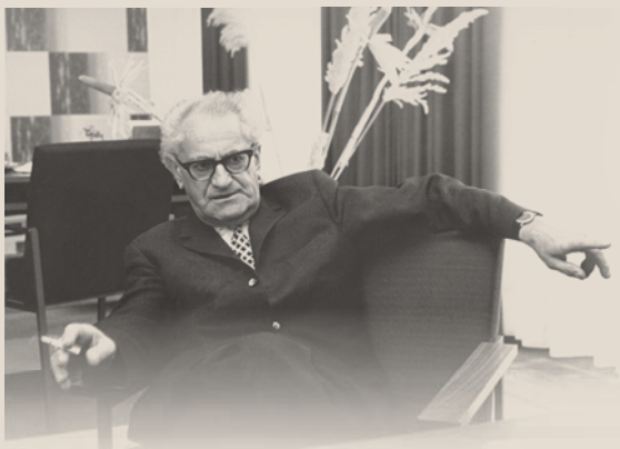
Fritz Bauer, 1963, Titelbild: Fritz Bauer 1965

Die Ausstellung dokumentiert seine Lebensgeschichte im Spiegel der historischen Ereignisse. Fritz Bauer, seinerzeit jüngster Amtsrichter Deutschlands, hatte in Heidelberg, München und Tübingen studiert. Als Jude blieb er vom Antisemitismus nicht verschont. Als Sozialdemokrat glaubte er dennoch an den Fortschritt, dann trieben ihn die Nationalsozialisten zur Emigration. Als Staatsanwalt revolutionierte Fritz Bauer das überkommene Bild des Amtes. An die Stelle der Staatsräson um jeden Preis trat der Schutz der Würde des Einzelnen, gerade vor staatlicher Gewalt – ein großer Schritt für die junge Demokratie.